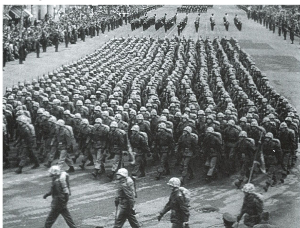
Un fotogramma de La rabbia

Le immagini di repertorio che scorrono nel film riguardano alcuni degli eventi più significativi degli anni '50, sia lieti sia dolorosi: l'invasione dell'Ungheria da parte dell'Unione Sovietica, la guerra di Corea, la guerra d'Algeria, le guerre di liberazione in Africa, la rivoluzione cubana, l'esplosione della bomba atomica, l'arrivo della televisione nelle case degli italiani, le alluvioni, l'elezione di papa Giovanni XXIII, l'incoronazione della Regina Elisabetta, la vittoria di Eisenhower negli USA, la morte di Marilyn, il primo volo nello spazio. Sono gli stessi fatti, gli stessi personaggi e persino le stesse immagini che uno spettatore