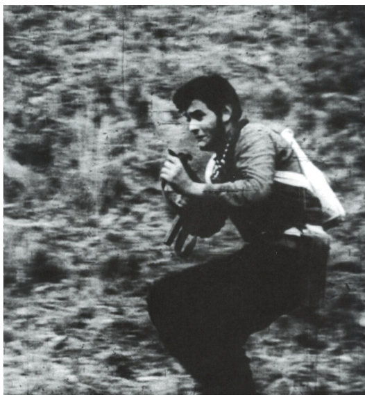
Un fotogramma de La rabbia

versione modernista per il lirico, o per il 'troppo poetico'.