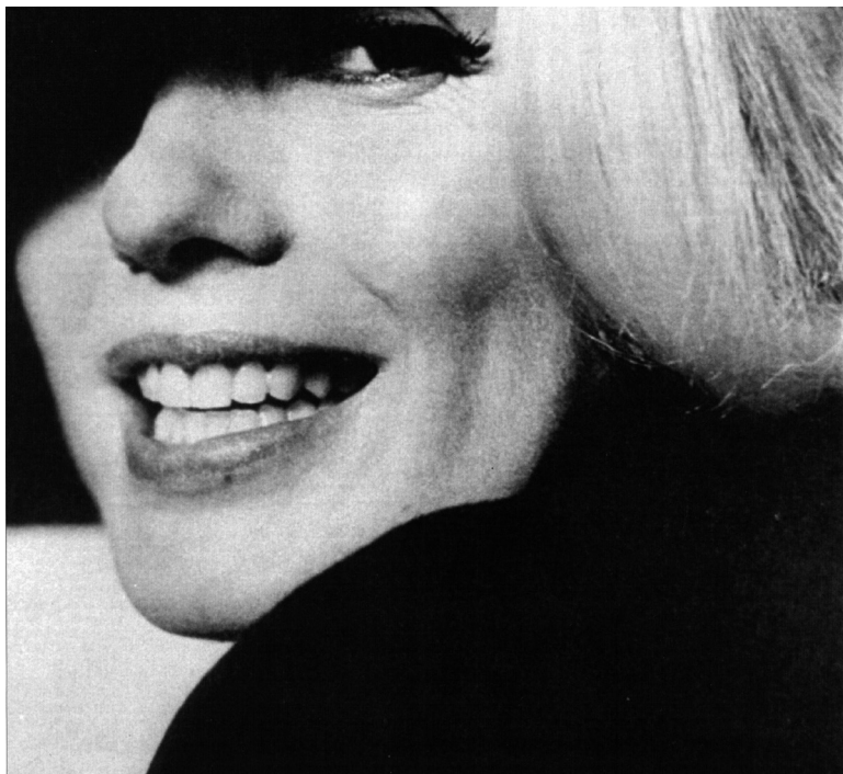
Un fotogramma de La rabbia

Eppure, nonostante le somiglianze e i punti in comune, i due film sono diversi, addirittura quasi opposti nel risultato, perché opposte sono le formae mentis che li sorreggono: apocalittica quella di Debord, tragica quella di Pasolini, come spiegherò meglio tra poco.