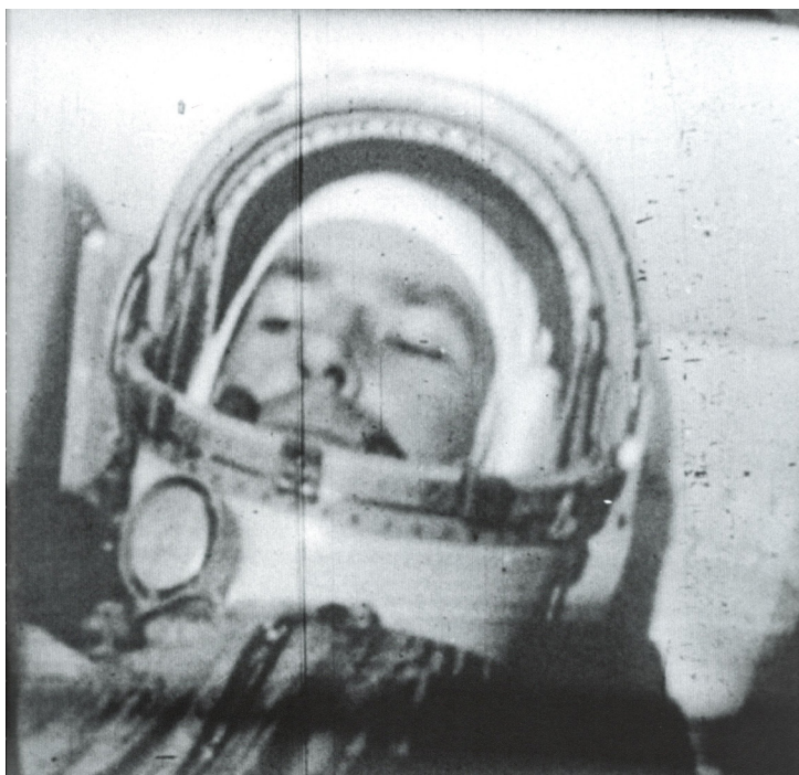
Un fotogramma de La rabbia

Quella di Pasolini invece è una forma mentis tragica, che non solo si fa canto, e dà voce alla pietà per il dolore degli uomini travolti dai nuovi poteri, ma ci fa anche percepire l'odierno corso della storia come non storicamente necessario. Terribile, certo, ma intollerabile – quindi non necessario. Nel film La rabbia ci sono anche forze che vanno in un'altra direzione, che fanno resistenza, come la bellezza di Marilyn o le guerre di liberazione in Africa: forse destinate a fallire, come tanti altri sogni dell'uomo, ma resta comunque forte per tutto il film anche il momento del sogno e della gioia, anch'essi presi dentro al canto.