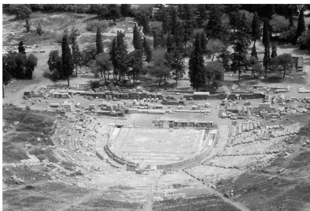
Rovine di un teatro greco

La rabbia viene talvolta frettolosamente definita un ‘documentario’. Ma se si guarda alla tecnica compositiva, si tratta più propriamente di un ‘film di montaggio’, o di un found footage film , o collage film , come altre volte vengono chiamati i film che fanno uso di materiali preesistenti. Qualunque ne sia l’etichetta, essi vengono comunque sempre considerati sotto la categoria di ‘cinema sperimentale’. La rabbia è in effetti un vero e proprio esperimento, nel senso che con questo film Pasolini scopre e porta alla luce nuove possibilità insite nel mezzo espressivo che usa, che non erano ancora state condotte fino a quel punto. Certamente, nel 1963, il cinema sperimentale di montaggio ha ormai alle spalle una lunga tradizione internazionale, che risale agli anni ’30 e che, ai suoi inizi, fu influenzata dalla tecnica surrealista del collage. L’espressione inglese found footage film riecheggia del resto